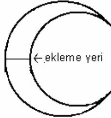
Şekil 2 - Ayyıldız işleme veya aplike sistemi ile yapılması durumunda, 300 cm x 450 cm'den daha büyük ebadlı Türk Bayraklarında ay'ın ek yeri

Ayın iki parçalı olarak imal edilemeyeceği büyüklükteki Türk Bayraklarında, ek yerlerinin sayısı ve yeri taraflar arası anlaşma ile belirlenmelidir.